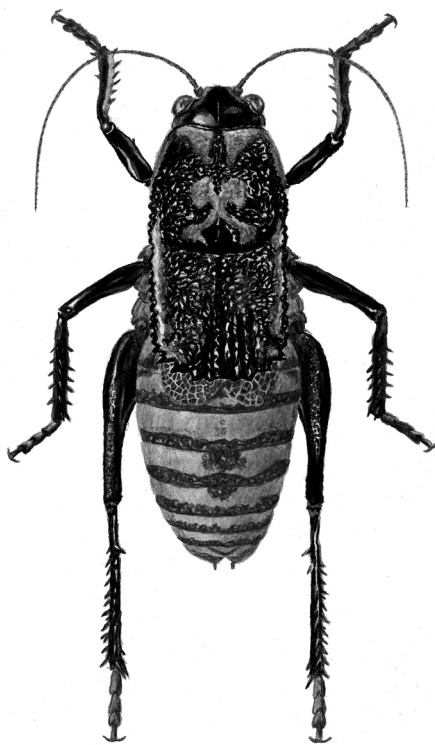
Onconotus servillei F.d.W., 1846, Red Data Book of Kazakhstan, by Vladimir Timokhanov