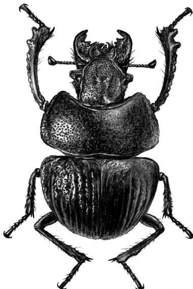
Lethrus tschitscherini Sem., 1894. (Red Data Book of Kazakhstan)