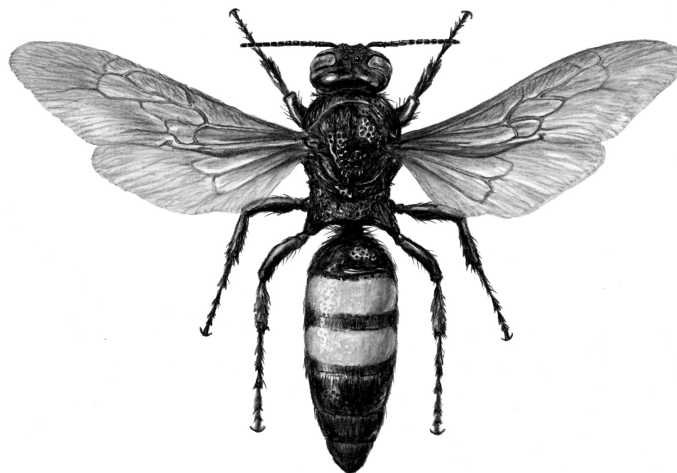
Scolia hirta Schrenk, 1781. (Red Data Book of Kazakhstan).